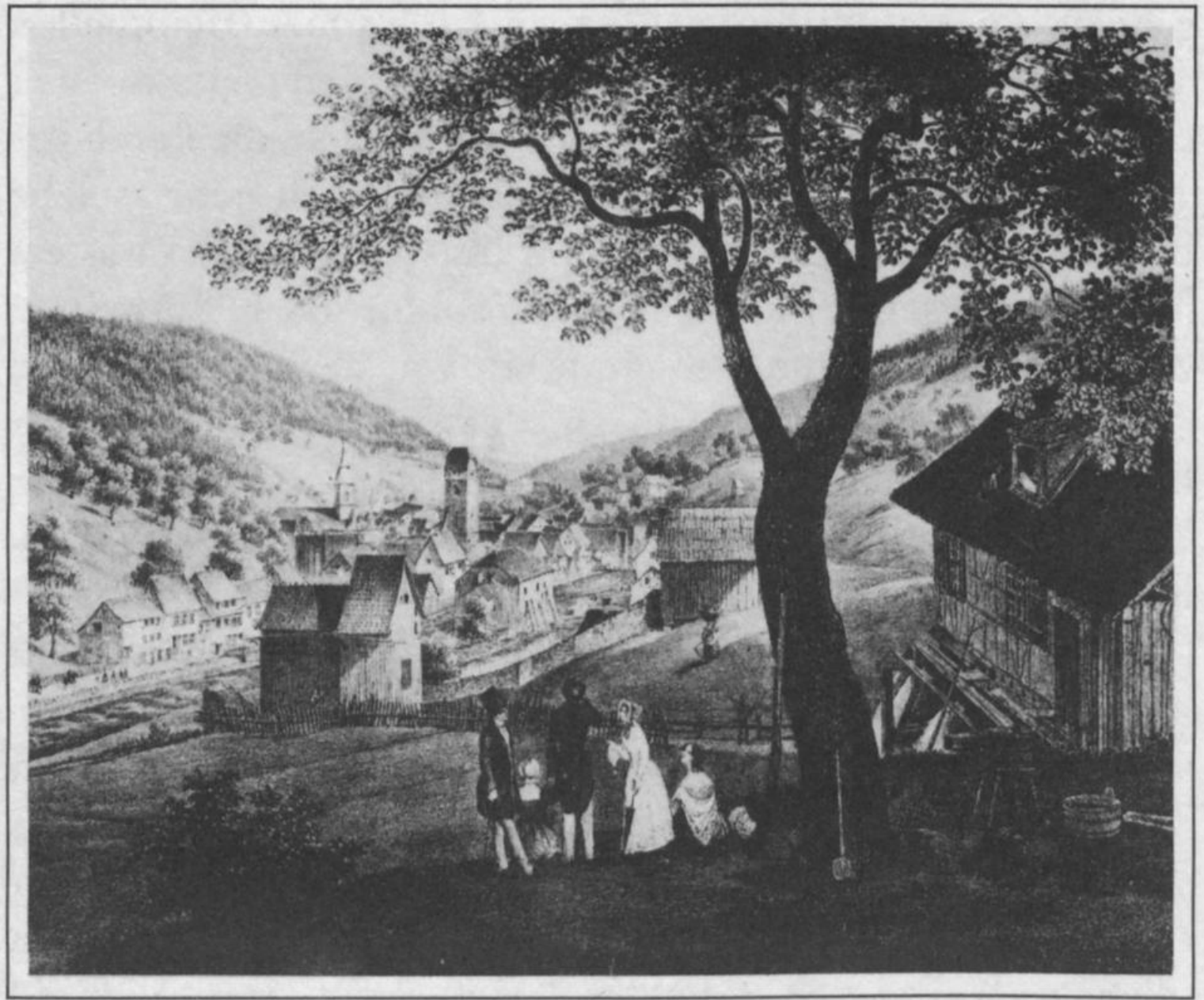
Wildbad um 1840